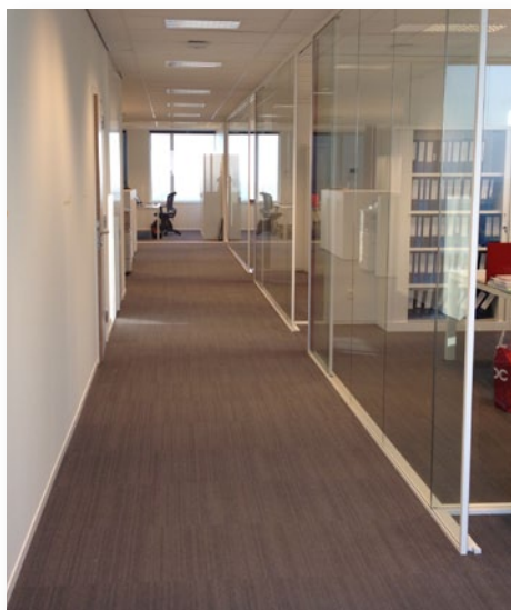
Kantoor Roeselare: een moderne toets en veel natuurlijke lichtinval

Het nieuwe kantoor in Roeselare zal als pilootproject fungeren voor de volledige organisatie. Zo zal er voor het eerst gewerkt worden met flexibele werkplekken waarbij niemand nog een vaste eigen stek heeft. De persoonlijke documenten en dossiers kunnen bijgehouden worden in een "eigen" kastje. Dit verhoogt niet alleen de capaciteit van het kantoor, maar zorgt ook voor meer interactie tussen de verschillende medewerkers wat het teamgevoel alleen maar vergroot. De cosy-corner en bibliotheek zijn de perfecte plaatsen om dossiers te bespreken zonder de andere collega's in de open ruimte te storen. De sfeer in deze hoek nodigt ook uit naar meer informele gesprekken.